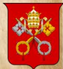
Armoiries du Vatican

Les deux saints étaient les patrons du prieuré de Coincy depuis le rattachement de ce dernier à la grande abbaye bénédictine de Cluny en Bourgogne. En effet, Guillaume d'Aquitaine qui avait fondé l'abbaye de Cluny en 909, l'avait dédiée aux apôtres Pierre et Paul et placé sous la protection du pape. De nos jours encore les armoiries du Vatican ont plus d'un point commun avec celles de Coincy : le fond rouge ainsi que les clés de Saint Pierre. Voilà un cousinage bien prestigieux qui s'explique par l'histoire !