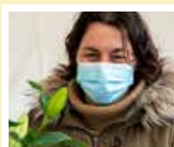
Accent Fleuri Coigny

Ce sont nos plus anciens producteurs locaux du marché, ils vous proposent leurs légumes du jardin.