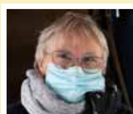
Champagne Belleville-Lemoine Domptin

Depuis plusieurs années, il vous fait profiter de sa passion des abeilles avec son miel et son pain d'épices.