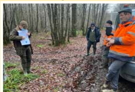
L'équipe municipale prépare l'inventaire du patrimoine forestier

Mais avec la croissance de la population, des conflits ont commencé à surgir entre les différents usagers de cette grande forêt. La tradition rapporte que Blanche d'Artois, comtesse de Champagne, donna en 1274 aux habitants riverains de la forêt de Ris le droit de couper « le bois nécessaire à