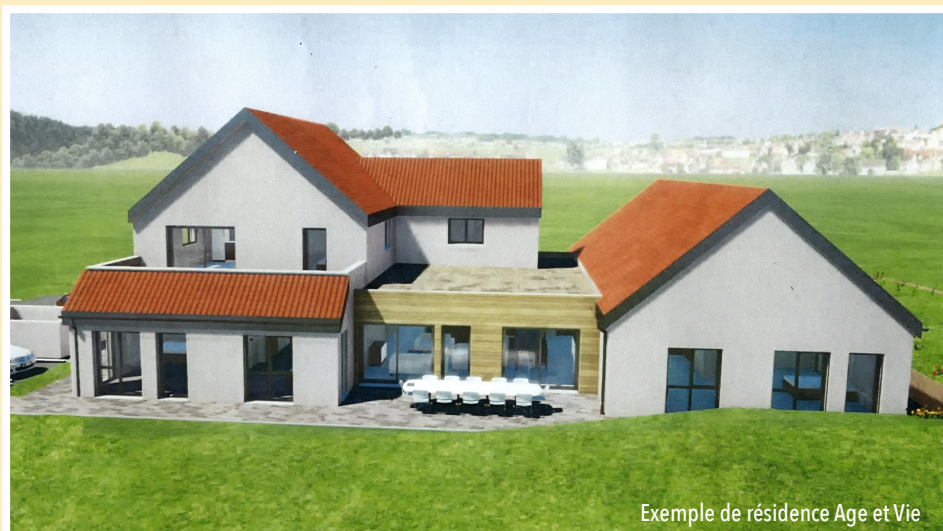
Exemple de résidence Age et Vie

La Mairie de Coincy a proposé d'implanter cette résidence sur une parcelle appartenant à la commune, derrière la salle polyvalente et près de l'école. Cela permet d'offrir aux résidents une proximité avec le